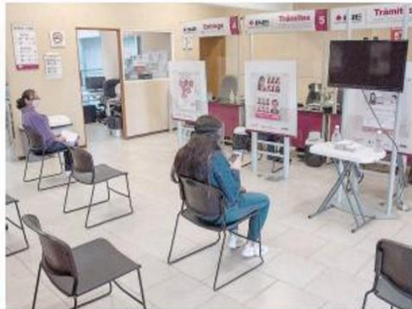
En los módulos no se brindará atención a las personas que se presenten sin cubrebocas, y en el lugar se deben observar las medidas de cuidado por la pandemia