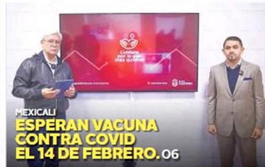
MEXICALI ESPERAN VACUNA CONTRA COVID EL 14 DE FEBRERO. 06