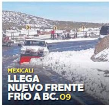
MEXICALI LLEGA NUEVO FRENTE FRÍO A BC. 09